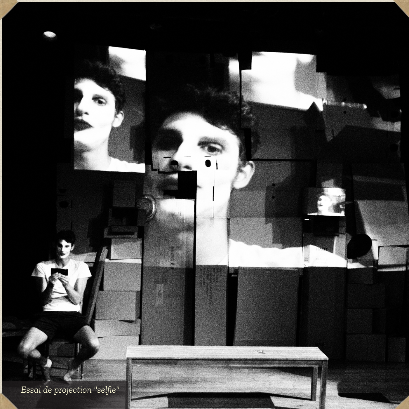
Essai de projection "selfie"