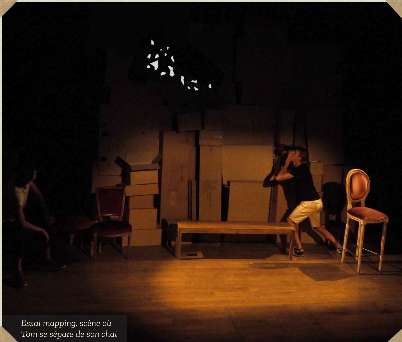
Essai mapping, scène où Tom se sépare de son chat