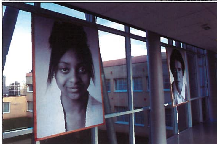
ART DE TOI à Boissy la Rivière, Étampes, au lycée Geoffroy Saint Hilaire