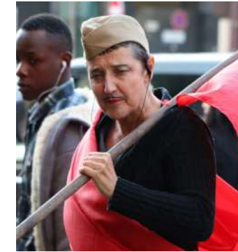
Tentative(S) d'Utopie Vitale