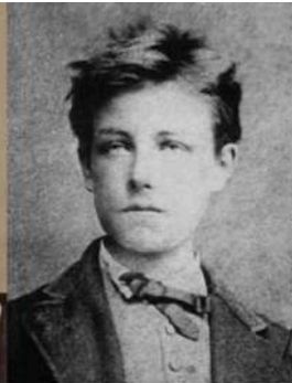
Arthur Rimbaud 1854-1891