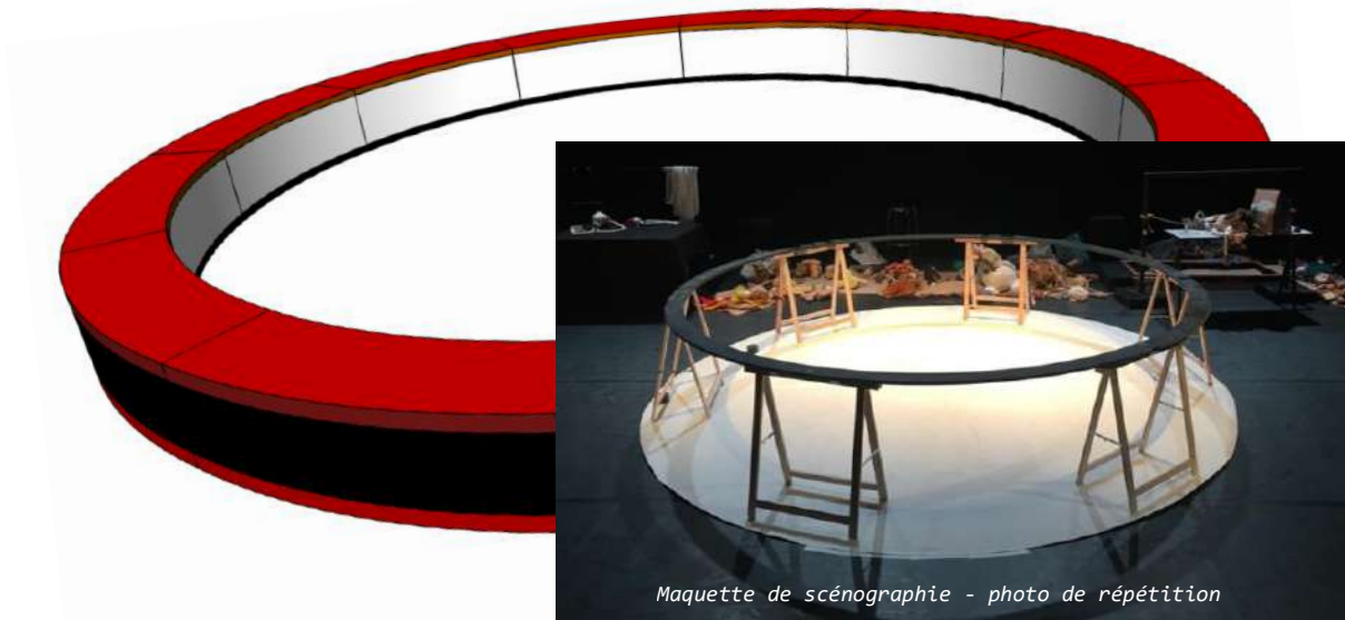
Maquette de scénographie - photo de répétition

Un grand castelet circulaire et tournant (avec le public en disposition frontale habituelle), évoquant la piste de cirque et le muret qui l'entoure - les manipulations ont lieu sur le cercle et à l'intérieur.