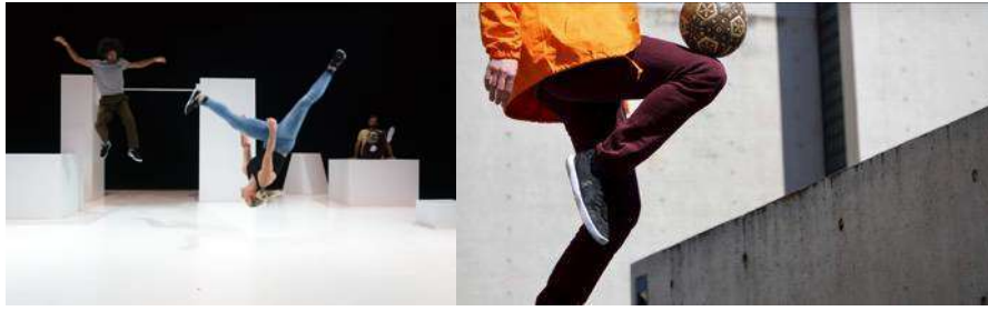
© Noah Bach & Jill Crovisier