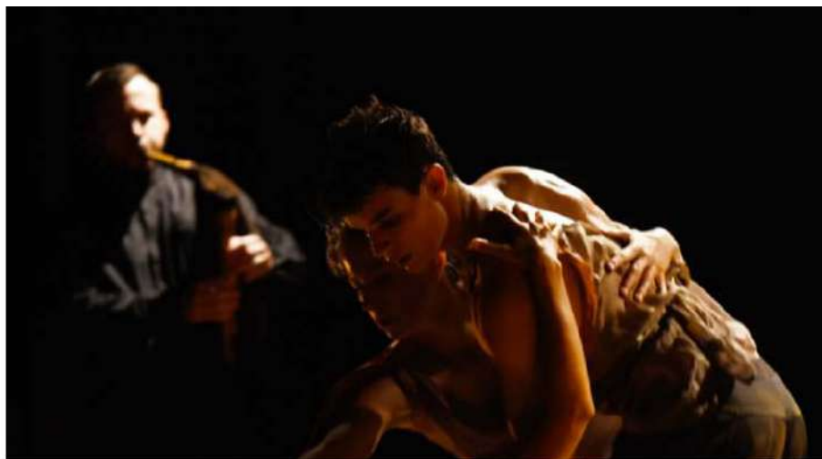
"L'Ambition d'être tendre" de Christophe Garcia

Le propos rejoint celui de Christian Rizzo et L'Ambition d'être tendre tend un miroir à D'après une histoire vraie (2013 - lire notre critique ). Là où cette dernière redécouvre la transe à partir d'un appareil très « contemporain » (esthétique blanche, batterie double sur un podium, etc...), la première plonge, via les outils d'aujourd'hui, aux racines. L'esthétique soignée, avec ses couleurs ocres et une danse très travaillée ne sont que des étapes pour Christophe Garcia pour une immersion dans ce qui, ailleurs et autrement, peut produire l'argia ou la tarentelle. Mais ici, la transe est dépouillée de sa coloration folklorique, débarrassée de reconstitution, concentrée sur l'excès pour dire quelque chose d'ici et de maintenant. A la différence des recherches de David Wampach (le récent Berezina - lire ici , mais plus encore Veine , 2014 - lire ici ), l'outrance et la démesure de la transe ne s'ancrent pas dans un primitivisme que révèle l'intime, mais dans un abandon au rythme et à sa puissance. L'Ambition d'être tendre tient de la mécanique chaleureuse, occupant une place juste entre le travail actuel de Rizzo et celui de Wampach... Jolie position !