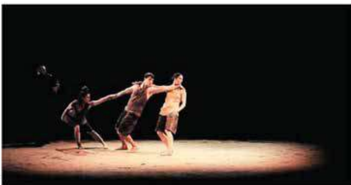
Le spectacle « L'Ambition d'être tendre » a été primé à Avignon.