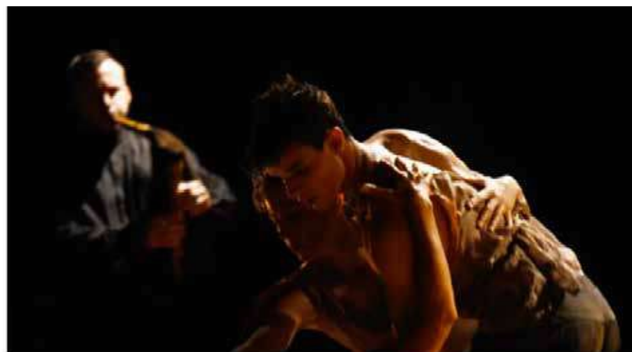
"L'Ambition d'être tendre" de Christophe Garcia

Le propos rejoint celui de Christian Rizzo et L'Ambition d'être tendre tend un miroir à D'après une histoire vraie (2013 - lire notre critique ). Là où cette dernière redécouvre la transe à partir d'un appareil très « contemporain » (esthétique blanche, batterie double sur un podium, etc...), la première plonge, via les outils d'aujourd'hui, aux racines. L'esthétique soignée, avec ses couleurs ocres et une danse très travaillée ne sont que des étapes pour Christophe Garcia pour une immersion dans ce qui, ailleurs et autrement, peut produire l'argia ou la tarentelle. Mais ici, la transe est dépouillée de sa coloration folklorique, débarrassée de reconstitution, concentrée sur l'excès pour dire quelque chose d'ici et de maintenant. A la différence des recherches de David Wampach (le récent Berezina - lire ici , mais plus encore Veine , 2014 - lire ici ), l'outrance et la démesure de la transe ne s'ancrent pas dans un primitivisme que révèle l'intime, mais dans un abandon au rythme et à sa puissance. L'Ambition d'être tendre tient de la mécanique chaleureuse, occupant une place juste entre le travail actuel de Rizzo et celui de Wampach... Jolie position !